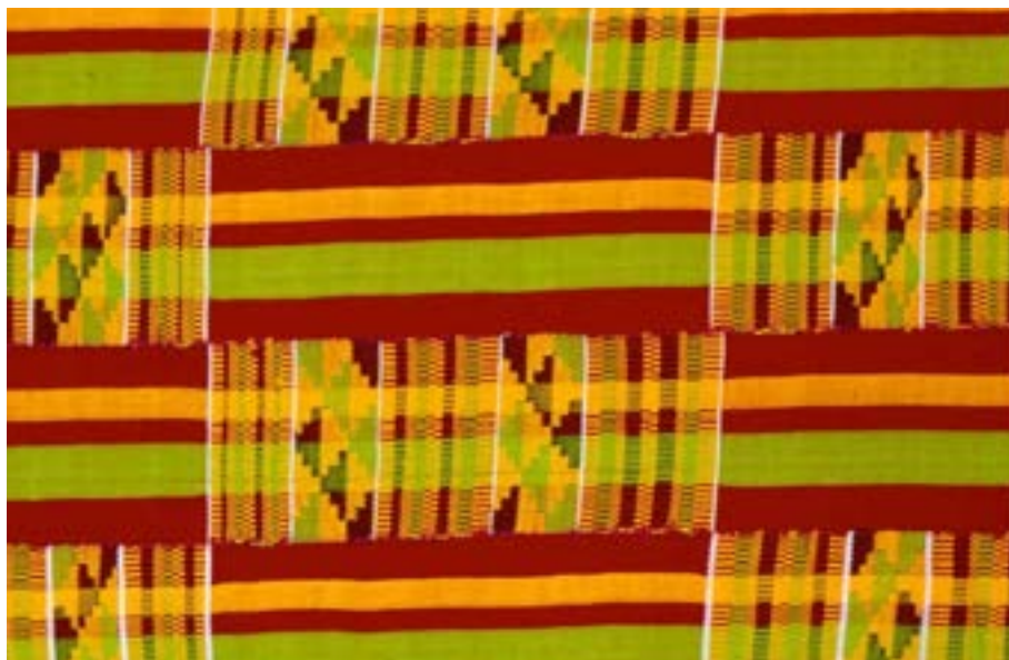
Imagem 09. Tecido Kente Ashanti. Fotografia de Alan Donovan. African Heritage House, Google Arts & Culture, s/d.