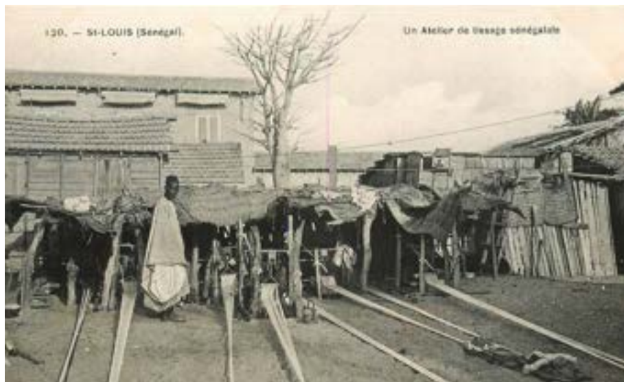
Documento 16. Cartão postal de Ateliê de tecelagem senegalês, pela estrutura longa do tear, percebe-se ser a técnica Manjak. Autor não identificado, s/d.