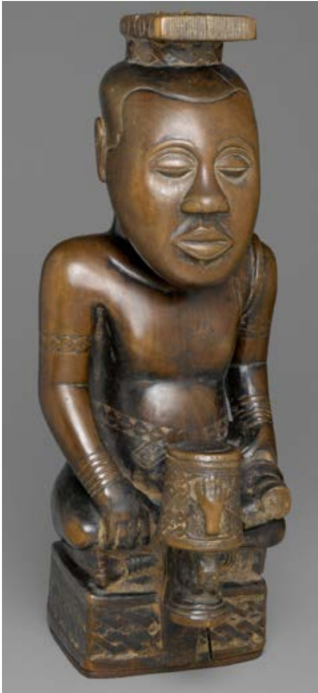
Imagem 36. Ndop, escultura em madeira do Rei Shyaam aMbul aNgoong, produzida pelos Kuba (1760-1780).