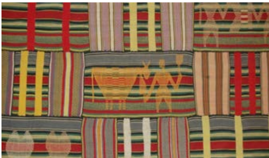
Imagem 10. Tecido Kente Ewe com figura humana, de animal e símbolo. The British Museum, s/d.

Documento 03 (à direita). Pôster Kente é mais do que um tecido: História e significado do tecido Kente de Gana. Prof. Kwaku Ofori-Ansa. O pôster inclui: Nomes dos tecidos e seus significados simbólicos; Nomes dos motivos e seus significados simbólicos; Partes de um tecido; Significados simbólicos das cores; Avaliando a qualidade dos tecidos; Usos do Kente; Materiais de tecelagem; e uma bibliografia selecionada. The Palace of Typographic Masonry, Amsterdã, s/d.