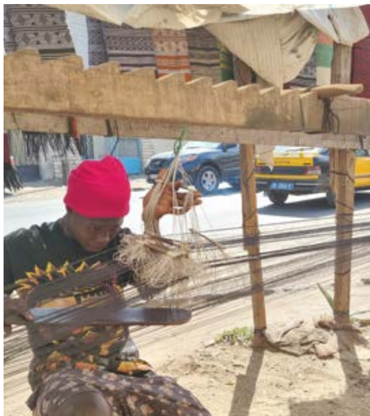
Imagem 66. Detalhe de homem trabalhando no tear Manjak. Le Balafon, s/d.